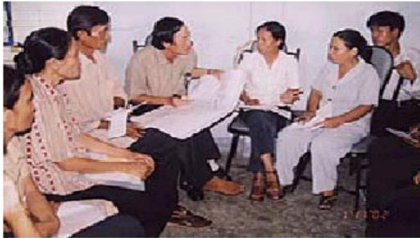
ମହିଳା ମାନେ ଆଲୋଚନା କରୁଛନ୍ତି ଏବଂ ସେମାନଙ୍କର ନିଜସ୍ୱ ବୈକଳ୍ପିକ ଜୀବିକା ଆରମ୍ଭ କରୁଛନ୍ତି ।

ପରିଚାଳନାର ଉନ୍ନତ ପାଇଁ ସାହାଯ୍ୟ କରନ୍ତି । ଏହି ଜୀବିକା କାର୍ଯ୍ୟକ୍ରମ ଦ୍ୱାରା ସଂପ୍ରଦାୟ ମଧ୍ୟରେ ମହିଳା ମାନଙ୍କର ସ୍ଥାନ ନିରୂପିତ କରାଯାଏ ।