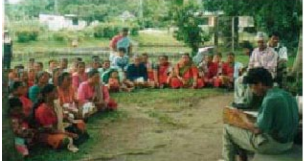
ପୋଡ଼ି ଦଳର ମାଆ ମାନେ

ଏହି ଗଳ୍ପଟି ଏକ ପୌରାଣିକ ଭଙ୍ଗୁର ସଂପ୍ରଦାୟର ୩୦୦ଟି ପରିବାର ଯେଉଁ ମାନଙ୍କୁ ପୋଡ଼ି ବା ଜଳାରୀ ବୋଲି କହୁଛି, ସେମାନେ ନେପାଳର ପୋଖରୀ ଉପତ୍ୟକାରେ ବାସ କରନ୍ତି । ସେମାନଙ୍କର ମାତୃଭାଷା ନେୱାରୀ ଭାଷା ସହିତ ବହୁତ ମିଳା ଢୁଳା ରହିଛି ଯାହାକି କାଠମାଣ୍ଡୁର ଆଦି ଭାଷା । ସେଥିପାଇଁ ସେମାନେ କାଠମାଣ୍ଡୁରୁ ଆସିଛନ୍ତି ବୋଲି କୁହାଯାଏ । ଏହା ଭଲ