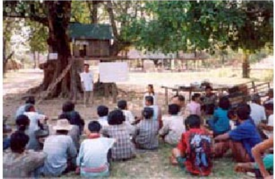
ଗୋଷ୍ଠୀ ଦେଖିବାକୁ ଲାଗିଲା ଯେ କିପରି ସେମାନଙ୍କୁ ସାହାଯ୍ୟ କରିପାରିବେ

ସହଭାଗୀ ଗ୍ରାମ୍ୟ ନିଜସ୍ୱ କାର୍ଯ୍ୟକ୍ରମ (PRA) ପୁରା ଗ୍ରାମ ସହ ଗୁଣାତ୍ମକ ତଥ୍ୟ ଉପରେ ଆଲୋଚନା କରିବାକୁ ଯୋଗ୍ୟ ବିବେଚିତ ହୋଇଥିଲେ । ଏହି ପଛଟି ସ୍ଥାନୀୟ ଜ୍ଞାନ କୌଶଳର ସମିଶ୍ରଣ ବ୍ୟବହାର ଏବଂ ଏକ ବିଶ୍ୱ ସ୍ତରୀୟ ପ୍ରତିଷ୍ଠା ପଛଟି (GPS) ଦ୍ୱାରା ଗୋଷ୍ଠୀ ମହାସଭାକୁ ଚିହ୍ନଟ କଲା ଏବଂ ଲିପିବଦ୍ଧ କରିରଖିଲା । ସହ ପରିଚାଳନା ମଧ୍ୟରେ ଥିବା ଦୂର ଏବଂ ଯୁକ୍ତ ବିରୋଧି ପରିଣାମ ଏସବୁ ଲିଖିତ ହେଲା । ଗୋଟିଏ ଗୋଷ୍ଠୀ ମହାସଭାର ବିକାଶ ଏବଂ କାର୍ଯ୍ୟ ନିର୍ବାହନ କ୍ଷମତାର ପରିବର୍ତ୍ତନ, ପ୍ରଶାସନ ପଛଟି, ସଫଳତାର ମହାସଭା ସମ୍ପ୍ରଦାୟ ଚିହ୍ନଟାଧାରର ଜ୍ଞାନ, ନିୟମ ଗୁଡ଼ିକର ବ୍ୟବହାର, ମହ୍ୟ ଆଶ୍ରୟ ସ୍ଥଳର ନିର୍ମାଣ, ନିରିକ୍ଷଣ ଦଳର ଗଠନ ଏହି ସବୁ ଦ୍ୱାରା ଅଧିକାରଗତ କରାଗଲା ।