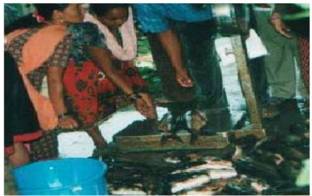
ସଂପ୍ରଦାୟର ମାଆ ମାନେ ପଞ୍ଜୁରୀ ମତ୍ସ୍ୟଚାଷରୁ ମାଛ ସଂଗ୍ରହ କରୁଛନ୍ତି ।

ସଂପ୍ରଦାୟର ଅଧିକାଂଶ ପରିବାର ତାଙ୍କ ପିଲାମାନଙ୍କୁ ସ୍କୁଲରେ ପଢ଼ାଇବା ପାଇଁ ସକ୍ଷମ ହୋଇଛନ୍ତି, ତିନୋଟି ଛାତ୍ର ବିଶ୍ୱବିଦ୍ୟାଳୟରେ ପଢ଼ିବା ପାଇଁ ସୁସ୍ଥିତ ହେଲେଣି । ଏହା ପୂର୍ବରୁ ଗୋଟିଏ ଶିକ୍ଷିତ ଲୋକ ଏହି ସଂପ୍ରଦାୟରେ ଖୋଜି ପାଇବା କଷ୍ଟକର ଥିଲା । ଅଧିକାଂଶ ପରିବାରରେ ଟି.ଭି., ଗ୍ୟାସ୍ ବୁଲି ଓ ସୌଚାଳୟ ରହିଛି ପୁଣି ଅଳ୍ପ କିଛି ଲୋକଙ୍କ ପାଖରେ ମଟର ସାଇକେଲ ଅଛି । କିଛି ପରିବାର ମଧ୍ୟବିତ ଜୀବନ ଶୈଳୀରେ ବାସ କରୁଛନ୍ତି ପୁଣି ସମୟ ଆସିବ ଯେତେବେଳେ କିଛି ମାଆ ତାଙ୍କ ସନ୍ତାନ ମାନଙ୍କ ପାଇଁ ସ୍କୁଲ ଖୋଲିବ ।