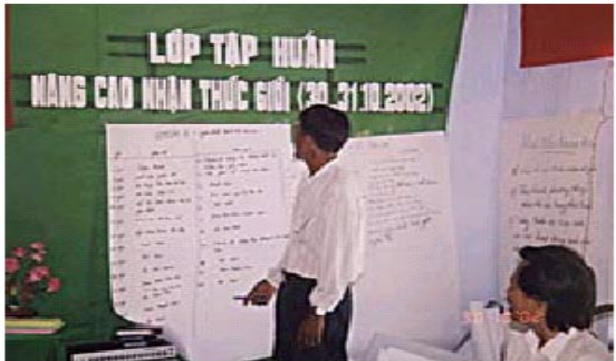
ମହିଳା ମାନଙ୍କ ଭୂମିକାରେ ପୁରୁଷ ମାନଙ୍କ ଚିନ୍ତାଧାରାକୁ ପ୍ରୋତ୍ସାହିତ କରାଯାଉଛି ।

ସହ-ଯୋଜନା କାର୍ଯ୍ୟକ୍ରମର ଏକ ଅଂଶରେ ଅକ୍ଟୋବର ୨୦୦୨ରେ ମହିଳା ମାନଙ୍କର ଦୁଇଟି ଚାଲିମ କାର୍ଯ୍ୟ ପ୍ରଣାଳୀ ଭାନ୍ ନିନ୍ ହୁ ଜିଲ୍ଲାର ଭାନ୍ ହୁଂଗ ଦଳର, ଦଳୀୟ କର୍ମଚାରୀ ଏବଂ ସଂପ୍ରଦାୟର ସଦସ୍ୟ ମଧ୍ୟରେ ଅନୁଷ୍ଠିତ ହୋଇଥିଲା । ୬୦ ଜଣ ଅଂଶ ଗ୍ରହଣକାରୀଙ୍କୁ ମହିଳା ମାନଙ୍କର ମୌଳିକ ଧାରଣା ବିଷୟରେ ପରିଚିତ କରାଗଲା ଏବଂ ଏହା ମଧ୍ୟ ଶିଖିଲେ ଯେ କିପରି ମହିଳା ମାନଙ୍କୁ ଉନ୍ନତ ଯୋଜନା ପାଇଁ ଚିହ୍ନଟ କରିବେ । ଏହି ଚାଲିମ ଦ୍ୱାରା ମହିଳା ମାନଙ୍କର ଜାଗୃତି ବଢ଼ିଲା । ସର୍ବଶେଷରେ ପୁରୁଷମାନେ, ମହିଳା ମାନଙ୍କର ପାରିବାରିକ ଅର୍ଥନୀତି ଏବଂ ସଂପ୍ରଦାୟର ଉନ୍ନୟନ ମୂଳକ କାର୍ଯ୍ୟକଳାପର ଭୂମିକା ପ୍ରତି ସକାରାତ୍ମକ ଦୃଷ୍ଟି ଦେଇଛନ୍ତି । ପୁରୁଷ ମାନଙ୍କର ବ୍ୟବହାରରେ ପରିବର୍ତ୍ତନ ଜଣା ପଡ଼ିଲା ଏକ ଶେଷ କଥପକଥୋନ ଏବଂ ପ୍ରଶ୍ନ ଉତ୍ତର କାର୍ଯ୍ୟକ୍ରମ ଦ୍ୱାରା ଏହା ସହିତ ମହିଳା ମାନଙ୍କର ଦକ୍ଷତା ମଧ୍ୟ ବୃଦ୍ଧି ପାଇଲା ।