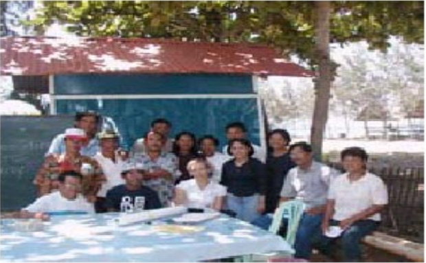
(ବାନାଟେ ବେ ସଂପଦ ପରିଚାଳନା, ପରିଚାଳନା ପରିଷଦ, ଆଇ ଏନ୍ ସିର ଏଫ୍ ଜି ଡ଼ି ଅଂଶ ଗ୍ରହଣକାରୀ)