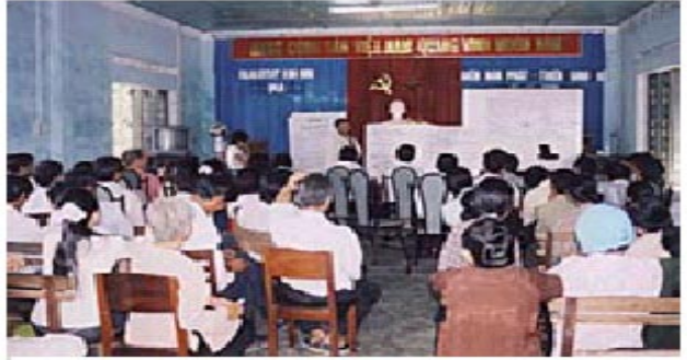
ଅଂଶ ଗ୍ରହଣକାରୀ ମାନଙ୍କୁ ଘରୁଆ ପରିବେଶରେ ଜୀବିକା ଧାରଣାର ପରିଚ୍ଛନ୍ନ ଦିଆଯାଇଛି ।

ତାଲିମ କାର୍ଯ୍ୟକ୍ରମ ପରେ ପରେ, ବିଚାର ବିପର୍ଣ୍ଣ କରିବା ପାଇଁ ଏକ ସ୍ଥାନ ପ୍ରସ୍ତୁତ କରାଗଲା ଯେଉଁଠାରେ ଗରିବ ମହିଳା ମାନଙ୍କର ବୈକଳ୍ପିକ ଜିବିକାରେ ନେତୃତ୍ୱ ନେବା ବିଷୟରେ କଥାବକାଥା ହେଲା । ଖାନ୍ ହୋଆ ମସ୍ତ୍ୟ କେନ୍ଦ୍ରର ଏକ ଦକ୍ଷ ଦଳ, (IMA) ଭିଏଟନାମର କିଛି କର୍ମଚାରୀ ଏବଂ ସ୍ଥାନୀୟ ଯୋଜନା ପରିଚାଳନା ସଂଘ ୬୦ ଜଣ ଲୋକଙ୍କୁ ନେଇ ଏଇ ବିଚାରବିପର୍ଣ୍ଣ ସଫଳ କରାଇଥିଲେ । ଜୀବିକା ବିଷୟରେ ଦକ୍ଷ ଲୋକ ମାନେ ଯୋଗଦାତା ମାନଙ୍କୁ ସେମାନଙ୍କର ସ୍ଥାନ ଅନୁଯାୟୀ ସଠିକ୍ ବୈକଳ୍ପିକ ଜୀବିକା ବିଷୟରେ ଜ୍ଞାନକାରୀ ପ୍ରଦାନ କଲେ । ଏହି ବିଚାରବିପର୍ଣ୍ଣ ଦଳ "ହନ୍ ମୁନ୍ ସାମୁଦ୍ରିକ ରକ୍ଷଣ ସ୍ଥାନ" 5 ର ପଦସ୍ଥ କର୍ମଚାରୀ ଓ ମରୁଆ ମାନଙ୍କୁ ଆକର୍ଷିତ କରିଥିଲେ ତାଙ୍କର ଅନୁଭୂତି ଓ ଶିକ୍ଷାରେ ଅଂଶ ଗ୍ରହଣ କରିବାକୁ ।