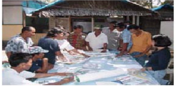
ଏଫ୍ ଜିଡ଼ି ଅଂଶ ଗ୍ରହଣକାରୀମାନେ ସେମାନଙ୍କର ବିଭିନ୍ନତା ଏବଂ ଛାପିତ ଉପକରଣର ପସନ୍ଦକୁ ଆଲୋଚନା କରୁଛନ୍ତି ।

ଏହି ପର୍ଯ୍ୟବେକ୍ଷଣ ପ୍ରସ୍ତୁତି ପାଇଁ, ସୁଚନାର ଫଳପ୍ରାପ୍ତ ସମ୍ପୂର୍ଣ୍ଣ ଚିହ୍ନଟ କରାଯାଇଛି । ଏହି ପର୍ଯ୍ୟବେକ୍ଷଣ ସମୟରେ ଜୁନ୍ ୧୧ ରୁ ୨୬ ୨୦୦୩ ଠାରୁ ଏହି ସାକ୍ଷାତକାର୍ଯ୍ୟ ମାନିଲା ସହର, ଏବଂ ଲୁଜୋନ୍ର ଅନ୍ୟାନ୍ୟ ସ୍ଥାନ ମାନଙ୍କରେ ପରିଚାଳନା କରାଯାଇଥିଲା । ମୁଖ୍ୟ ସଂବାଦଦାତା ସହିତ ସରକାରୀ ସଂସ୍ଥାର ପ୍ରତିନିଧିମାନେ, ଜଳ ସମାଜ, ଏବଂ ମୁନିସିପାଲ୍ ସରକାର ଏଥିରେ ଯୋଗ ଦେଇଥାନ୍ତି । ଏଥି ସହିତ ମାଛ ଧରାଳି ଜନସାଧାରଣ ସହିତ ଫୋକସ୍ ଦଳ ବାଦାନ୍ତୁବାଦ, ଗ୍ରାମ୍ୟ ଅଧିକାରୀ, ଏବଂ ମହାପ୍ରାଣ ଧନସାଧାରଣ ଅନୁଷ୍ଠାନର ପ୍ରତିନିଧିମାନେ ତିନୋଟି ଉପକୂଳବର୍ତ୍ତୀ ପୌରପାଳିକାରେ ପରିଚାଳିତ ହୋଇଥାନ୍ତି ।