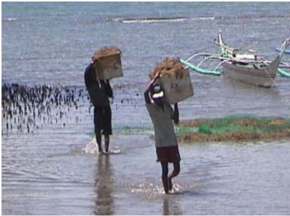
Ang naani nga seaweed nga yara sa Styrofoam bices gonakarga sang mga mangingisda sang Barangay Tiabas. San Dionisio. Iloilo

Ang Bureau of Fisheries and Aquatic Resources (BFAR) Regional Office No 6 amo ang ahensiya sang gobyerno nga responsable sa pagpauswag, pagdumala kag pagkonserbar sang palangisdaan kag iban pa nga dunang manggad sa katubigan sa Western Visayas. Ini yara sa idalum sa direkta nga superbisyon kag kontrol sang Sekrtaryo sang Departamento sa Agrikultura. Katulad sang iban nga ahensiya, ang BFAR nagtuhaw kag nakaagi sa madamo na nga pagbaylo para masundan ang madasig nga pagsanyog sang industriya sa pangisda.