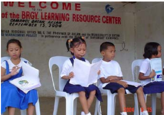
Mga estudyante sa primera grado sa elementariya nagabasa sang mga ginsulat nila nga estorya nahanungod sa mga butang sa ila palibot

Ang BLRC nauna gintukod sa Sapián Bay sa Barangay Mambuquio, Batán, Aklan. Tatlo ka BLRC ang gindugang tukod sa Barangay Napti, Batán, Aklan, kag Barangay Balaring kag Cabugao sa Ivisan, Capiz. Ang pinakabag-o gintukod upod sa suporta sang STREAM Philippines, sa Barangay Camangi, Batán, Aklan sang September 2004. Ang programa naglakip sang mensahe halin sa Barangay Kapitan, isa ka presentasyon nahanungod sa BLRC sang pinuno sang BFAR IEC unit, ang seremonya sa paghatag sang mga libro kag iban pa nga mga materyales sa mga representante sang gobeyrno-lokal sang munisipyo kag barangay kag sang pag-utod sang laso.