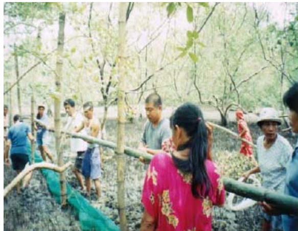
Mga babaye sang NMPC aktibo nga nagpartisipar sa paghimo sang kurong sang alimango sadtong tatlo ka adlaw nga training

Ang training nagalakis sang lecture kag hands-on nga aktibidad sa paghimo sang kurong sang alimango. Ang importansiya sang ikosistema sa katunggan, biology kag pagsagusod sang alimango, pagtukod sang komite sa pagdumala, pagsulat sa monitoring nga pormas, kag pagplano sang mga buluhaton ang gindiskusyon sa lecture . Ang mga komite nga gintukod para mamuno sang nagakalainlain nga responsibilidad: finance and administration, feeding, monitoring, marketing kag inventory . Ang mga miyembro gintunga man sa pito ka grupo para sa adlaw-adlaw nga monitoring kag pagpakaon. Ang mga miyembro sang Finance kag Administration Committee ang ginhanas sa simple bookkeeping . Napanilagan man nga ang mga babaye sang NMPC aktibo nga nagpartisipar sa paghimo sang kurong kag natapos ini sa sulod sang tatlo ka adlaw.