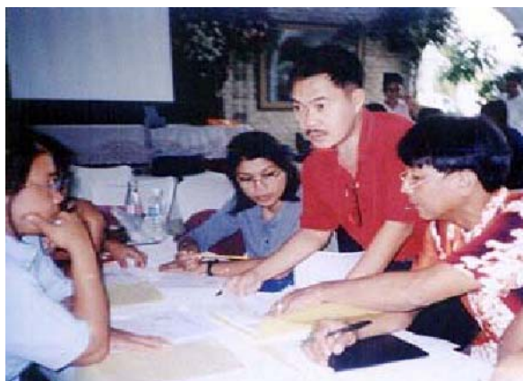
Partisipasyon sang LGU partner-implementers sang BFAR sa pagplano nagapaseguro nga may ara sila nga "tingug" sa pag-obra sang polisa. Si Mr. Espinosa makita nga naga-estorya sa mga fisheries extension officers nahanungod sa workplans nila

Ang masami nga buluhaton sa PMED nagalakip sang paghimo sang planning workshops, provincial orientations, kag sang monitoring and evaluation sang nagakalain-lain nga programa kag proyekto sa pangisda. Diri sini nga mga okasyon nga ang mga nagakalain-lain nga stakeholders nagadiskusyon kag nagatan-aw sang mga nahimo nila, pagpat-ud sang mga isyu kag problema nga may epekto sa implementasyon sang programa, kag pagkuha sang rekomendasyon halin sa mga partners: reperesentante sang local government units (LGUs), provincial fisheries coordinators, report officers, kag kon kaisa provincial agriculturists.