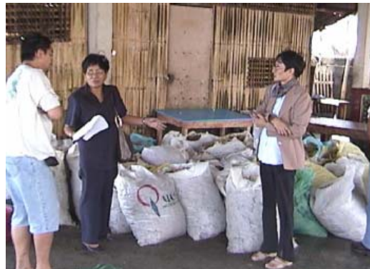
Mala nga nabulad nga seaweed sa sulod sang mga sako

Bilang isa ka bag-o ginhimo nga ahensiya, ang BFAR nagatinguha nga sabton ang panawagan sang panahon nga pabakuron ang iya mga serbisyo, labi na gid sa mga mangingisda kag iban pa nga mga sektor sa industriya sa pangisda. Ang Industriya sa Pangisda sa Pilipinas nagasakop sang tatlo ka sektor sang aquaculture, marine kag post-harvest. Ang pinaka sentro nga serbisyo sang BFAR nagalibot sa partisipasyon sang pribado sini nga sektor. Ang BFAR's vision, mission : nga may mangin moderno nga pagpangisda, nagakalain-lain nga ekonomiya nga aktibo, abanse sa teknolohiya kag makapa-indis sa iban nga nasyon, kag pagbag-o nga