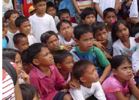
Ang mga estudyante sa Camanci nakatuon ang tanan nga mga talinga samtang gina-estorya ana "Lorkan"

Ginapanan-aw nga ang BLRC magserbe nga isa ka database para sa estado sang dunang manggad sa kadagatan sang Sapiian Bay. Ang mga mangingisda makakolekta sang data paagi sa adlaw-adlaw nila nga obserbasyon, mag-diskusyon kag magproseso sang impormasyon, kag maghimo sang malahalon nga mga suhestiyon sa pagdumalahan para sa tayuyon nga kauswagan sang Sapiian Bay. Ang lokal nga gobyerno makahatag suporta sa operasyon sang sentro paagi sa paghatag sang tuigan nga budget. Ang mga eksperyensiya sa sini nga barangay mapaambit, mapa-uswag kag ma-ilog sa iban nga lugar sang Sapiian Bay. Makabulig ini sa kabuhi sang mga komunidad sang mangingisda.