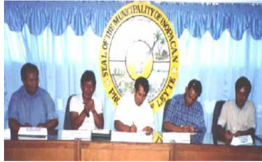
Pirmahanay sang MOA sang mga LCEs sang mga nagapartisipar nga LGUs

paghugpong, kalakip diri ang Municipal Agriculture Officer (MAO), representante sang Philippine National Police (PNP) kag SB on Agriculture and Fisheries. Ang grupo naghimo sang Memorandum of Agreement (MOA) nga ginpirmahan sadtong Abril 2002 sang mga LCE sang anum ka nagapartisipar nga munisipyo. Ang pinaka-importante sa MOA amo ang pagporma sang isa ka integrated FARMC. Ginklaro man ang papel sang IFARMC kag-ang suporta nga igahatag sang mga LGU.