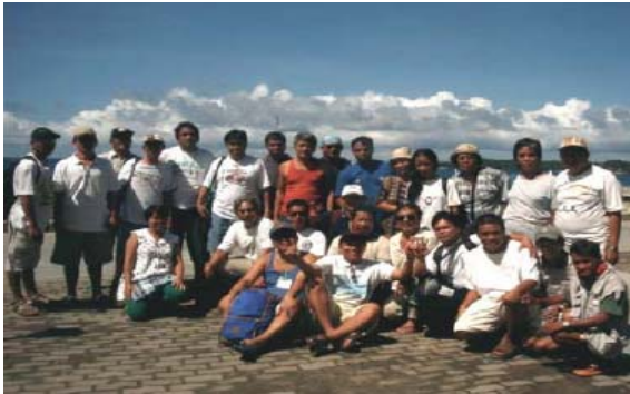
Mga IMFARMC participants nga nagstudy tour sa Aklan kag Iloilo

Ang IFARMC nagpaidalum sa mga paghanas kag seminar para mapasanyog kag mapa-uswag ang iya kapasidad bilang isa ka organisasyon. Kalakip sa mga capacity-building nga aktibidad amo ang leadership and values training, oryentasyon sa importante nga mga punto sa New Fisheries Code of 1998, paralegal enhancement sang FARMC law enforcement arm, Bantay Dagat, kag study tour para sa mga pinuno sang IMFARMC sa mga lugar nga may CRM sa Aklan kag Iloilo.