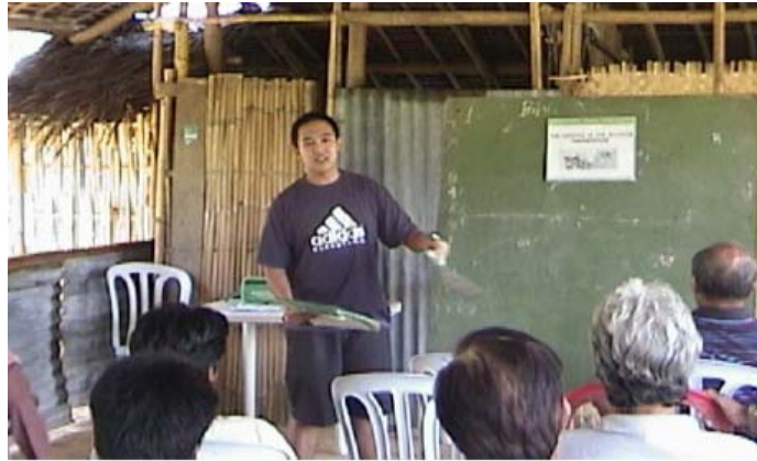
Extension staff nagahatag sang seminar nahanungod sa pagsagud sang seaweed sa mga mangingisda sa Batan, Aklan

Ang Western Visayas may yara nga 170 Fisheries Extension Officers sa idalum sang ila nga mga local government units (LGU). Nagabra sila upod sa BFAR 6 para maimplementar ang mga programa sa pangisda, proyekto kag mga buluhaton sa ila mga munisipyo. Nagahatag man sila sang suporta sa serbisyo-teknikal sa mga nagakinahanglan sa bilog nga rehiyon kag nagabulig man dugang sang manpower sang BFAR. Ang BFAR padayon nga nagaserbisyo sa mga interes sang nagakaon kag nanamian sang isda nga mga tawo.