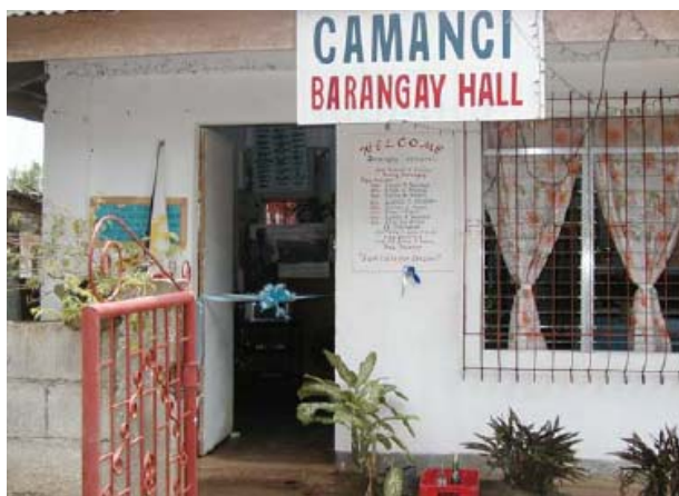
Ang Camanci Barangay Hall nga sa siin yara and BLRC ginbutang

Ang BLRC ginabutang sa isa ka barangay nga may yara nga lugar nga mabutangan sang isa ka hulot-balasahan nga may kabinet para sa mga libro, la mesa, siya, kag isa ka hulot nga mahiwatan sang pulong-pulong kag training. Ang FRMP amo ang nagakolekta sang mga balasahon kag mga materyales para sa BLRC ukon nagapangayo sang donasyon kag kontribusyon halin sa mga nagabulig nga tawo ukon ahensiya. Mga posters kag iban pa nga instructional materials katulad sang tapes kag CDs ang ginahatag sa sentro. Mga donasyon para sa audio-visual nga mga gamit ang aktibo nga ginapangita para nga ang BLRC masami nga makapasundayag sang mga