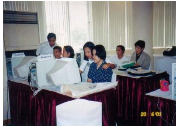
Training bahin sa Geographic Information System (GIS) upod sa mga katapo sang BFAR Regional Offices kag sang PhilFIS coordinators

Ang naga-implementar nagpatigayon sang sunod-sunod nga training sa data management , halin sa operation and maintenance sang system , kag pag-organisar sang bag-o kag masaligan nga impormasyon para masuportahan ang paghimakas para sa kauswagan sang dunang manggad sa pangisda. Sunod sini, ang system gin-deploy sa mga coastal municipalities paagi sa paghatag sang computers, softwares kag ginakinahanglan nga training para epektibo nga magamit kag madumala ang system . And Fisheries Management Units sa mga munisipyo ginginhgyo man nga magsugod butang sang mga data sa databases para masanay sila sa system kag mangin eksperto sa paggamit sini kag episyente sa pag-implementar sang PhilFIS sa mga munisipyo.